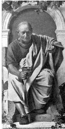
クイントゥス・ホラティウス・フラックス Quintus Horatius Flaccus BC.65.12.8–BC.8.11.27 古代ローマ時代の南イタリアの詩人

写真の日時計にはラテン語で“Carpe Diem”（カルペ・ディアム）と彫ってあります。英語では“Seize the day”、日本語では「その日を摘め」と訳されています。そこには「その日を楽しみ、精一杯いきること」という意味があります。紀元前1世紀の古代ローマの詩人ホラティウスの詩に登場する句で、映画“Dead Poets Society”（1989年、邦題「いまを生きる」ロビン・ウィリアムズ主演）にも出てきます。