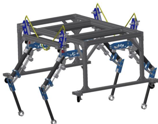
Fig.1 Overview of Tough Runner

Tough Runner は油圧シリンダをアクチュエータとする 4 脚ロボットであり、各脚 3 自由度ずつの計 12 自由度を持つ。立位姿勢時の全容は図 1 に示すとおりである。なお、ロボット