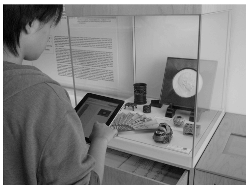
写真 1. 展示品点検作業風景

そして、この開発アプリケーションでは、インターネットに接続できないオフライン環境においても情報入力が可能であり、いかなる場合においても、作業とその記録の一体化が保持されるよう工夫した。