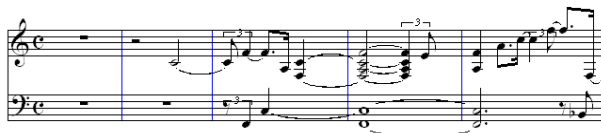
図 3: 市販ソフトによる評価データの採譜の冒頭部

評価データは、電子ピアノ (YAMAHA Clavinova CLP-970) による演奏者 1 名による「トロイメライ」の演奏の MIDI データを用いた。