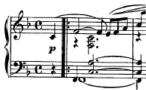
図 2: 評価データのオリジナル楽譜の冒頭部

クラシック音楽のピアノ曲の演奏を用いて、提案手法の評価を試みた。多声部を含む楽曲では、8分音符や16分音符で刻む IOI が等間隔でつながる単純なリズムパターンの曲が多く、そのような曲は市販ソフトのクオンタイズ手法により比較的良好に認識できる。しかし、楽譜の指示や自然な表情づけなどでテンポの変動を含み、IOI のパターンも複雑である曲の場合は容易でない。例えばシューマン作曲「トロイメライ」(図 2) は、演奏を市販の楽譜作成ソフトの採譜機能を用いて音価の推定をしたところ、に対する部分の結果が図 3 となるように、全く認識できなかった。