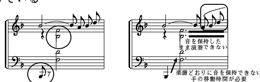
図 4: 音価推定の誤認識例 (左: 認識結果, 右: 正解)

飾音の分だけ短い IOI が挿入され、これが Step 2 における誤認識と数えられた。同時発音は全て正しく検出できており、装飾音に対する対処が必要である。もう一点は、実際の演奏が楽譜どおりに演奏されていないためである。トロイメライでは物理的に楽譜の音価のとおり鍵盤を押さえるのが困難である箇所があり、後処理 (Step 3) によっても原譜が復元できなかった。例えば図 4 に示すように、鍵盤上での腕の移動や、手の大きさや指の構造などにより、継続時間音が楽譜の指示よりも短く演奏し、誤認識と数えられている。実際の演奏制約のために、楽譜どおりに音が継続しなかった箇所を正解に数えた場合の認識率を、表 2 「補正認識率」に示す。装飾音の演奏と、記譜法と実際の演奏方法との違いについての対処は、今後の課題である。また、トロイメライに現れる IOI 系列のようなパターン (リズムベクトル) は、学習データ (7 曲) での出現頻度が小さいものが多く、そのために open, closed での認識率に大きな差が生じている