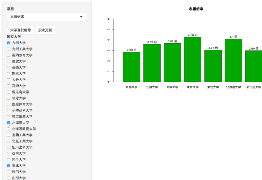
図 2 学校基本調査に基づく分析