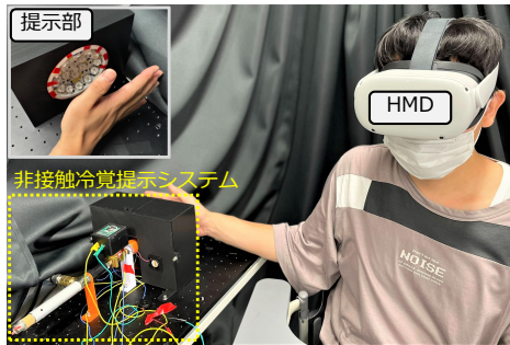
図 3: 体験している様子

図 3 にデモンストレーションを体験している様子を示す。体験者が HMD を装着し、手を非接触冷覚提示システムの提示部に向けて置いてデモンストレーションを体験する。図 4 に示すように、氷の玉が飛んでくる一時的な冷