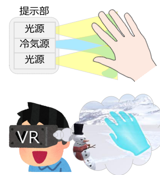
図 1: 提案手法のデモ展示